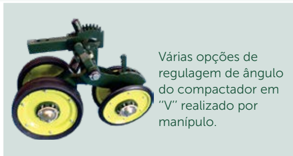
Várias opções de regulagem de ângulo do compactador em "V" realizado por manipulo.