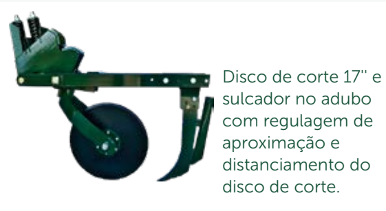
Disco de corte 17" e sulcador no adubo com regulagem de aproximação e distanciamento do disco de corte.