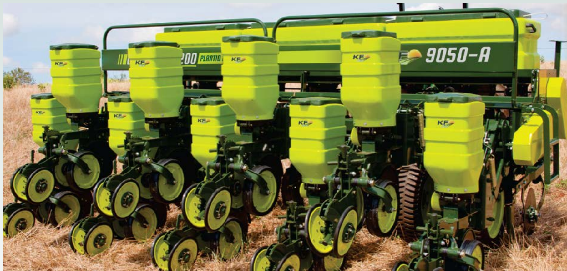
Engate para suspensão da linha utilizado no plantio de culturas como o milho, por exemplo, sem necessidade de remoção da mesma.

Os modelos Geração 4200 são máquinas práticas e versáteis para manutenção.