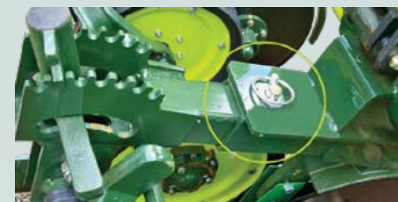
Tubo de encaixe com opções de regulagem que permite aproximar ou afastar o sistema de compactação em relação ao disco duplo da semente.