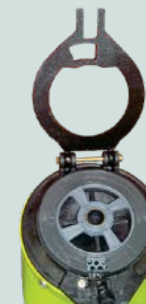
Sistema de troca rápida de disco de semente e anel base.