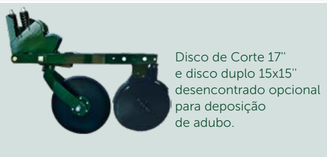
Disco de Corte 17" e disco duplo 15x15" desencontrado opcional para deposição de adubo.