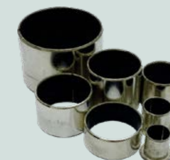
Buchas especiais com bronze sinterizado auto lubrificantes em todas as articulações da plantadeira.