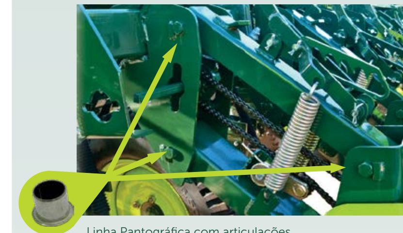
Linha Pantográfica com articulações contendo buchas auto lubrificantes. Ragulagem de pressão sem utilização de chaves com diversos níveis de tensão do disco duplo da semente contra o solo.